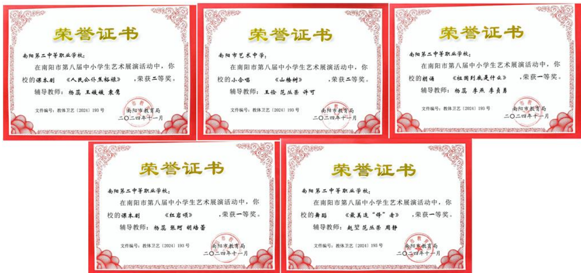
图 39: 师生参加艺术展演获奖证书 (部分)