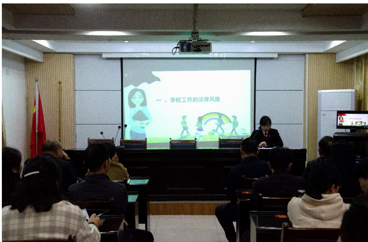
图 40：邀请南阳市中级人民法院法官来校讲法