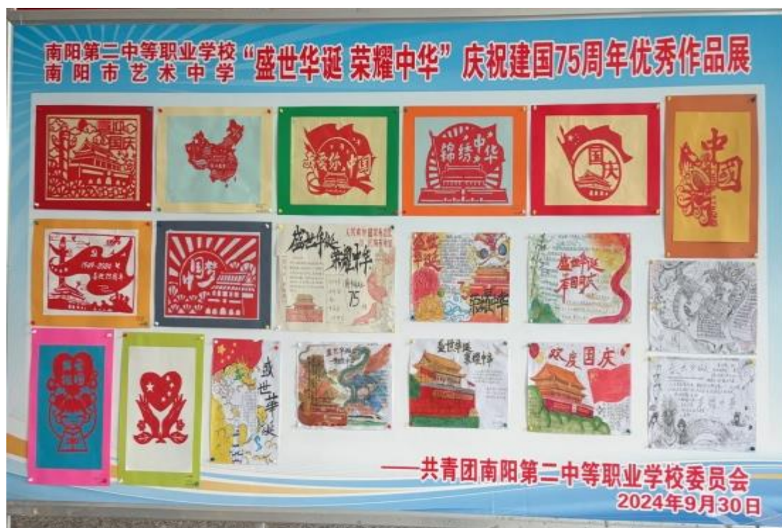
图 19：“剪绘辉煌岁月共庆盛世华诞”剪纸手抄报作品展示