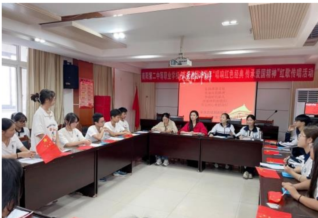
图 18：“唱响红色经典传承爱国精神”红歌传唱活动

（九）传承爱国精神，开展实践活动。 为推动思政教育落实落地，本年度团委共策划开展校内外主题实践活动十数场，包括“春节、清明节、端午节、中秋节”等“我们的节日”系列传统节日庆祝活动、“社会主义核心价值观主题教育活动”、“探索心路历程呵护心理健康”心理健康研学活动、庆祝建国 75 周年“唱响红色经典传承爱国精神”红歌传唱活动和“剪绘辉煌岁月共庆盛世华诞”剪纸手抄报作品征集展示活动等，引导广大学生学习发扬中华优秀传统文化，树立正确的价值观念。