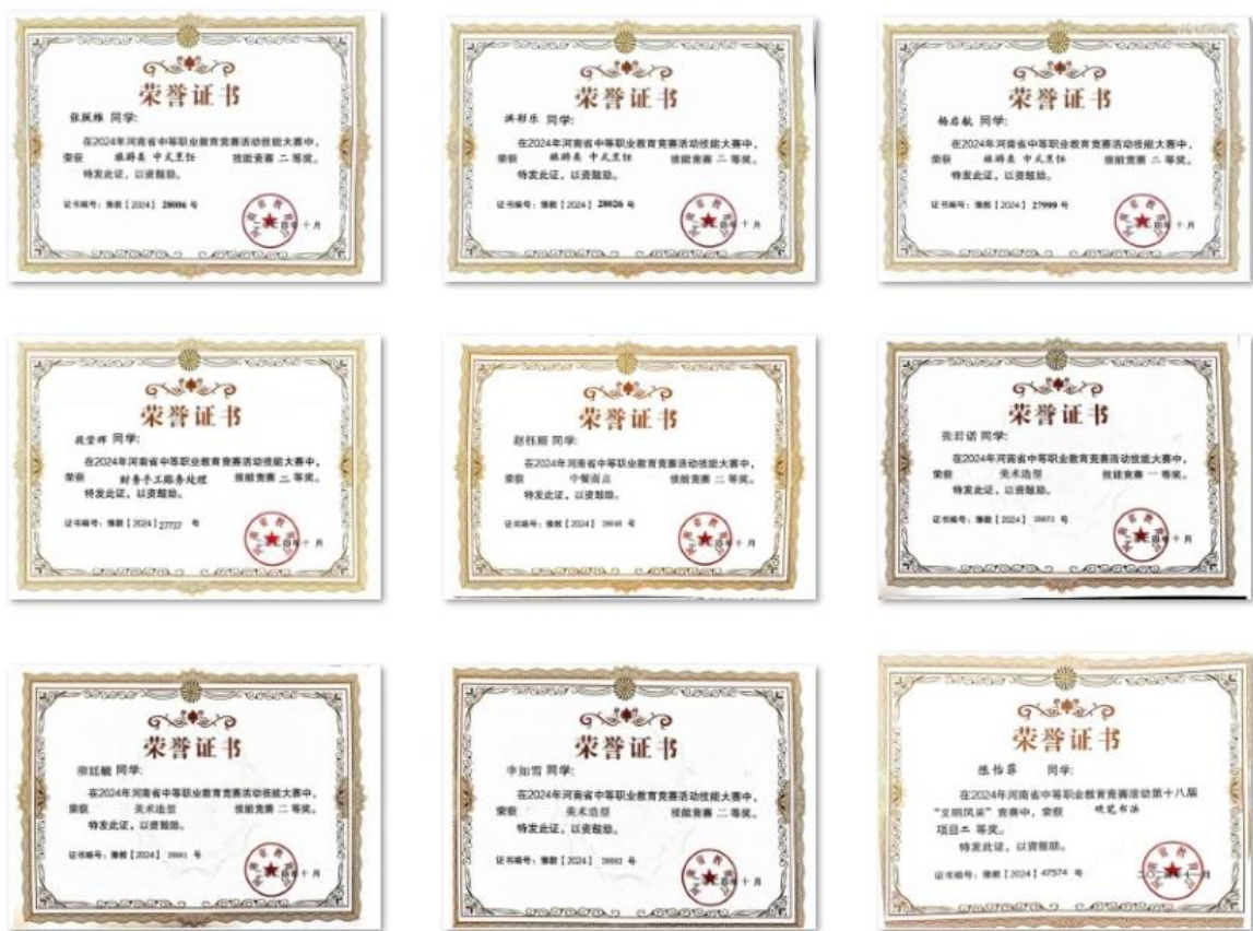
图 38: 学生参加技能大赛获奖证书 (部分)