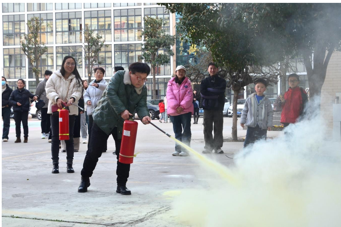
图 42：学习使用灭火器

四是做好预防。有计划地组织隐患排查整改，防患于未然。每月组织开展消防等应急疏散演练，白加黑，白天和夜晚疏散相结合，切实提高学生安全自救能力。在学生中加强法制教育，成立学生管理工作部，推进校园文明建设。