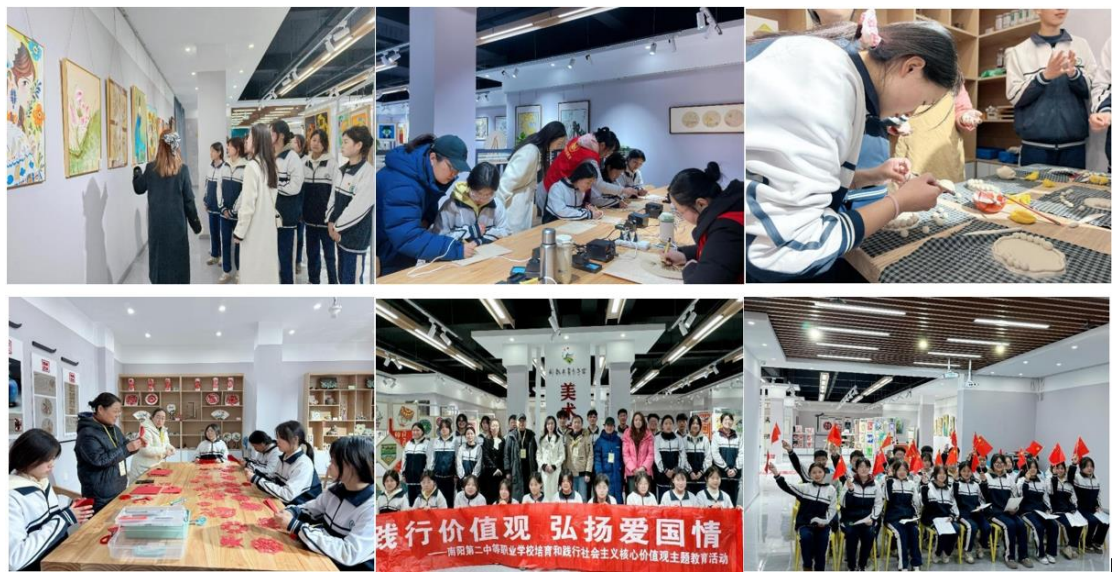
图 23: “践行价值观弘扬爱国情”社会主义核心价值观主题教育活动