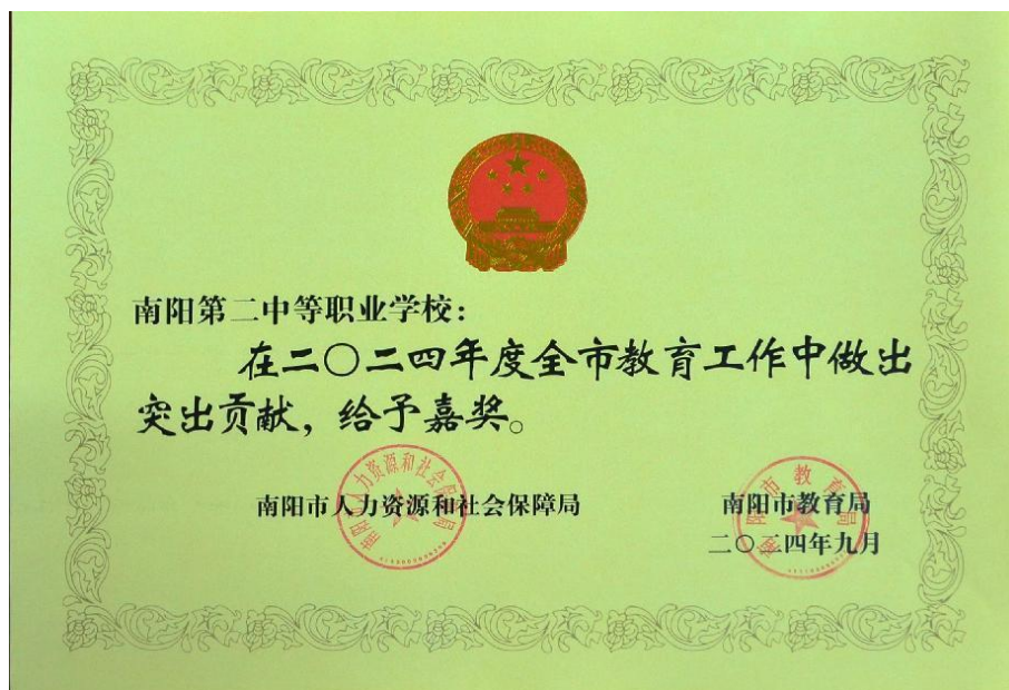
图3：被南阳市人社局、教育局“给予嘉奖”