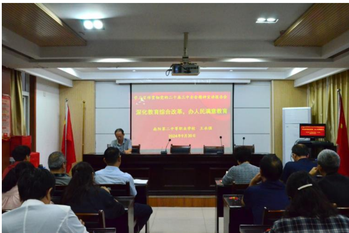
图 8：学习宣传党的二十大精神

学校坚持以习近平新时代中国特色社会主义思想为指导，全面贯彻落实党的二十大、二十届二中、三中全会精神，不断加强党对学校工作的全面领导，坚持社会主义办学方向，坚持为党育人、为国育才，有效落实好党组织领导的校长负责制，坚持“围绕中心抓党建，抓好党建促发展”理念，继续强化党组织“把方向、管大局、做决策、抓班子、带队伍、保落实”的主体责任，充分发挥党组织的战斗堡垒作用和党员的先锋模范作用，为促进学校高质量发展提供了坚强组织保障和政治基础。