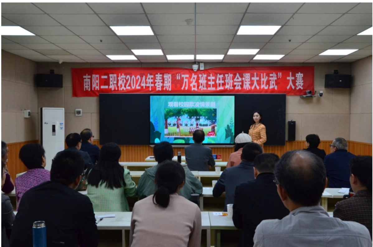
图 10：2024 年春季“万名班主任班会课大比武”大赛

（四）学校领导带头讲思政课。学校党总支书记和校长多次给师生讲思政课，对促进青少年学生上好思政课，提升思政课质