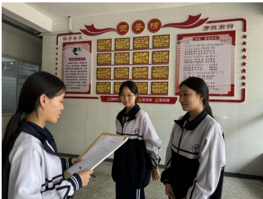
图 29: “垃圾分类始于心青山绿水鉴于行”志愿服务活动