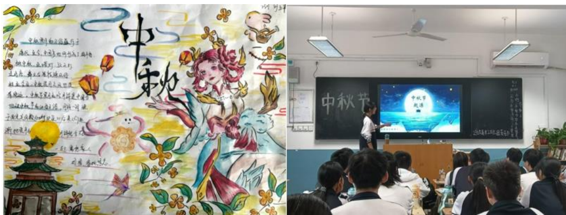
图 21：“我们的节日——中秋节”庆祝活动