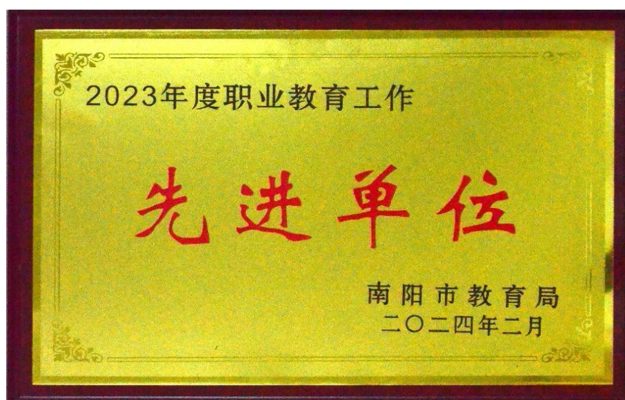
图 4：获评“2023 年度职业教育工作先进单位