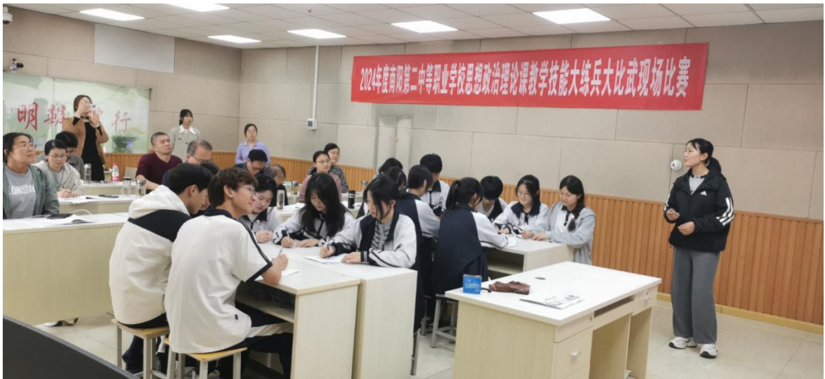
图 9：开展思政课教师教学技能大比武