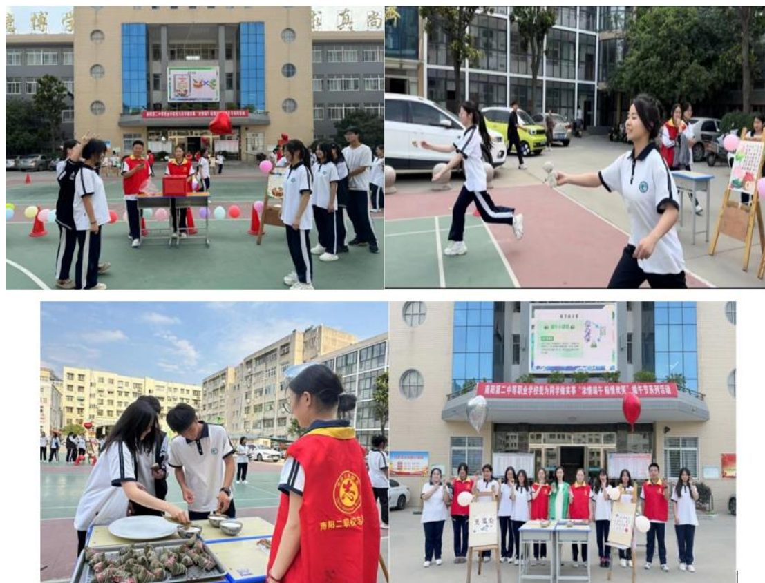
图 20：“浓情端午，粽情欢笑”端午节系列活动