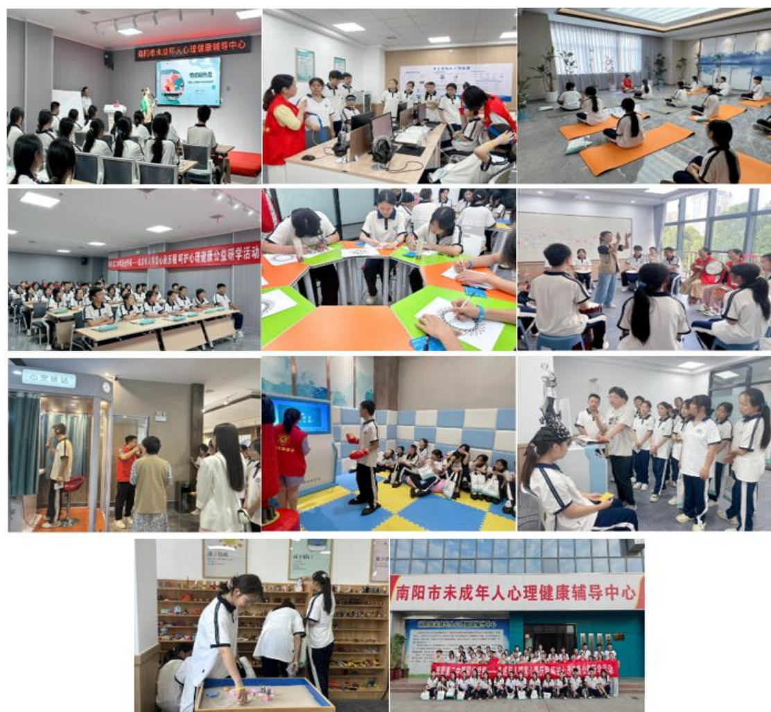
图 24: “探索心路历程呵护心理健康”心理健康研学活动