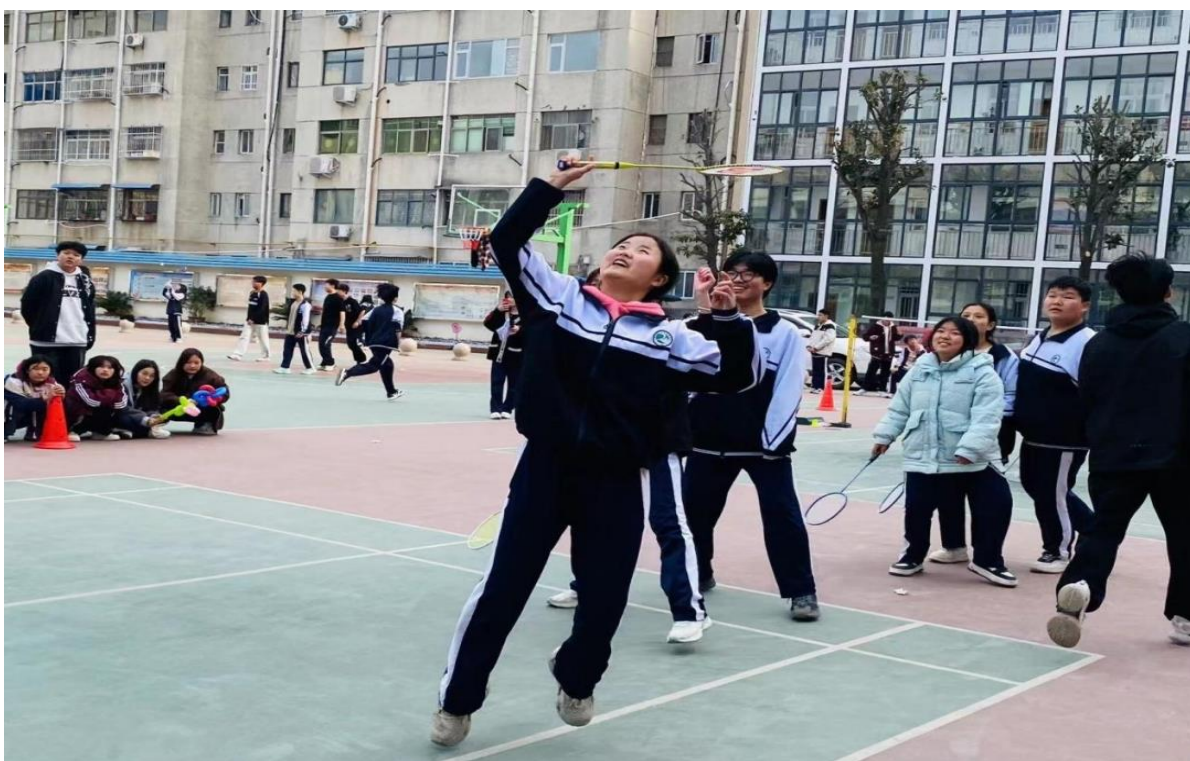
图 31: 羽毛球比赛