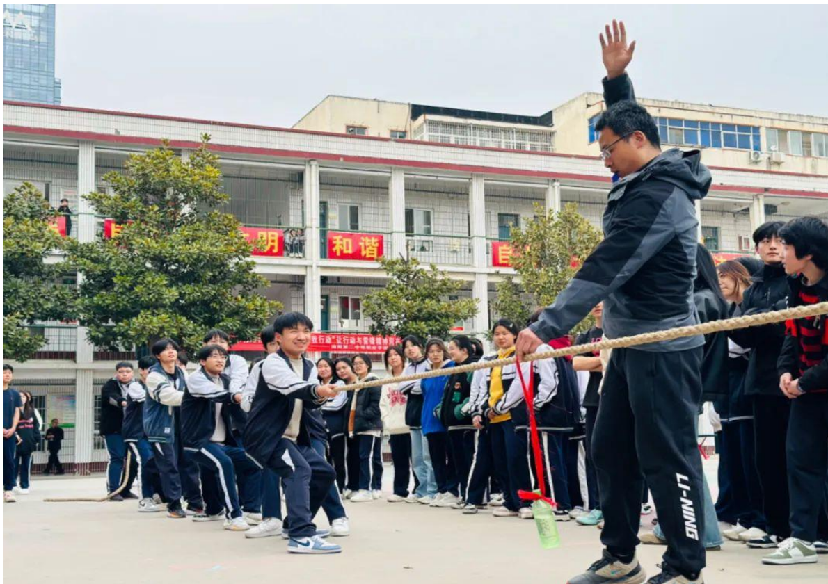
图 30: 拔河比赛