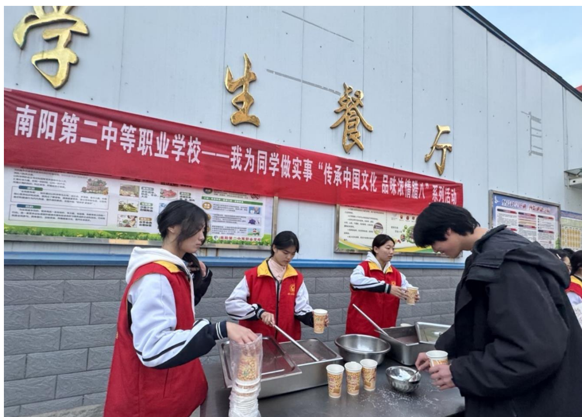
图 22：我为同学办实事