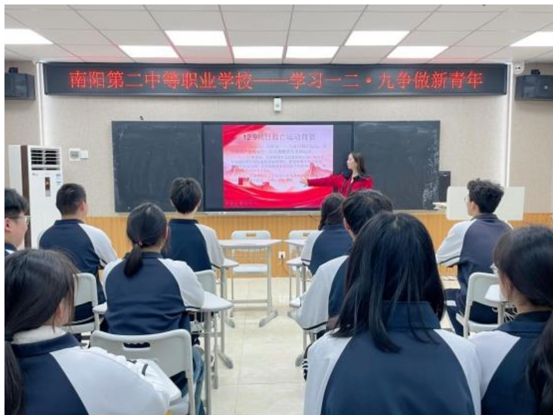
图 17: “学习一二·九争做新青年”主题团课