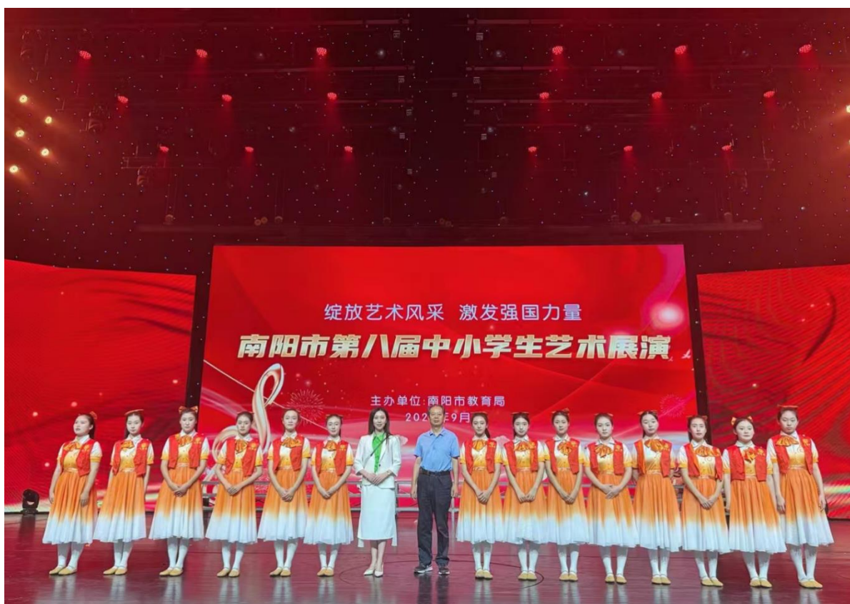
图 36：参加南阳市第八届中小学生艺术展演