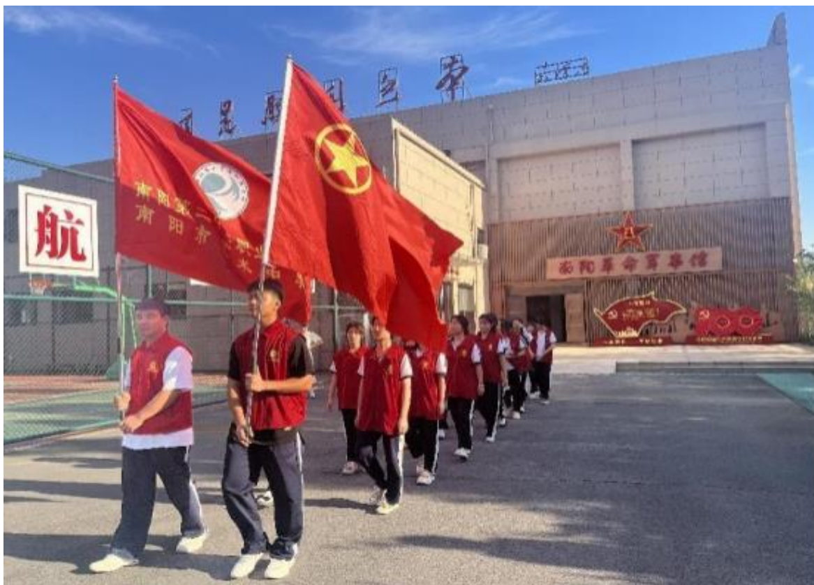
图 13：参观南阳革命军事馆

（七）评先评优树立学习榜样。通过开展师德教育培训、专题讲座、学生评教和“师德标兵”、“最受欢迎教师”、“学科带头人”评选等，促使爱岗敬业、为人师表、热爱学生的品德成为全体教师的共同追求。通过评选“文明班级”、“三好学生”、“优秀班团干部”等优秀集体和个人，使学生学有榜样，做有标杆，促使学生形成良好思想品德。