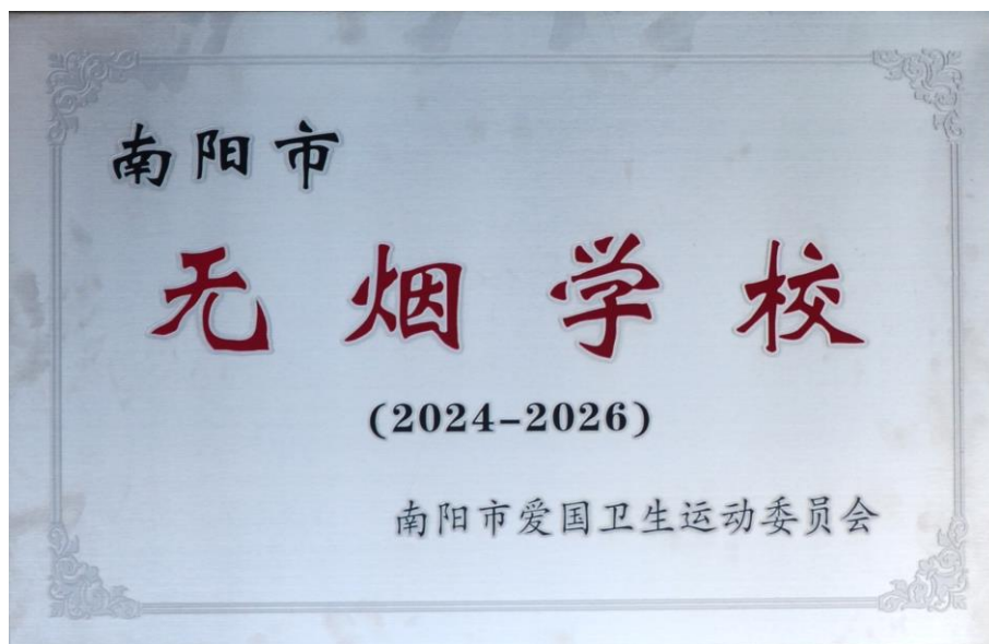
图2：南阳市无烟学校