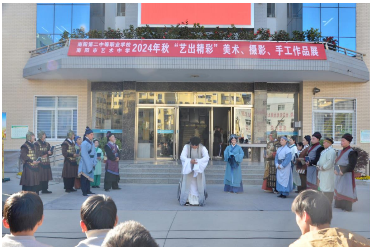
图 12: 南阳市曲剧团进校演出《医圣仲景》