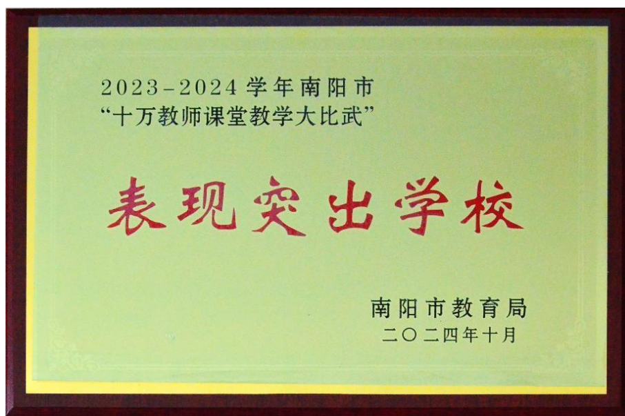
图 7：2023-2024 学年南阳市“十万教师课堂教学大比武”表现突出学校