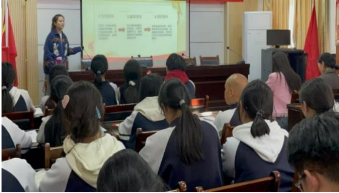
图 16: “唱响团歌嘹亮 共谱青春华章”主题团课