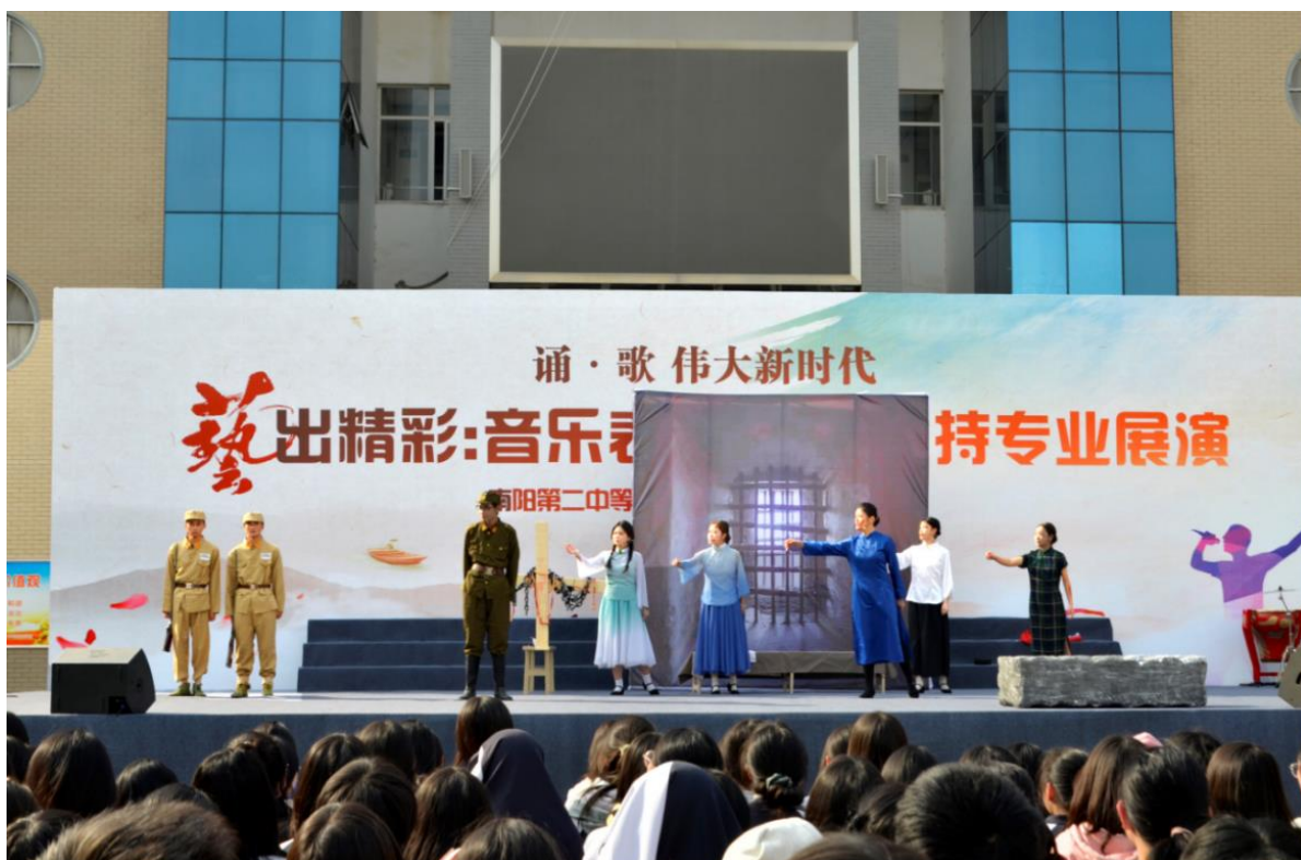
图 11: 学生表演《红岩颂》