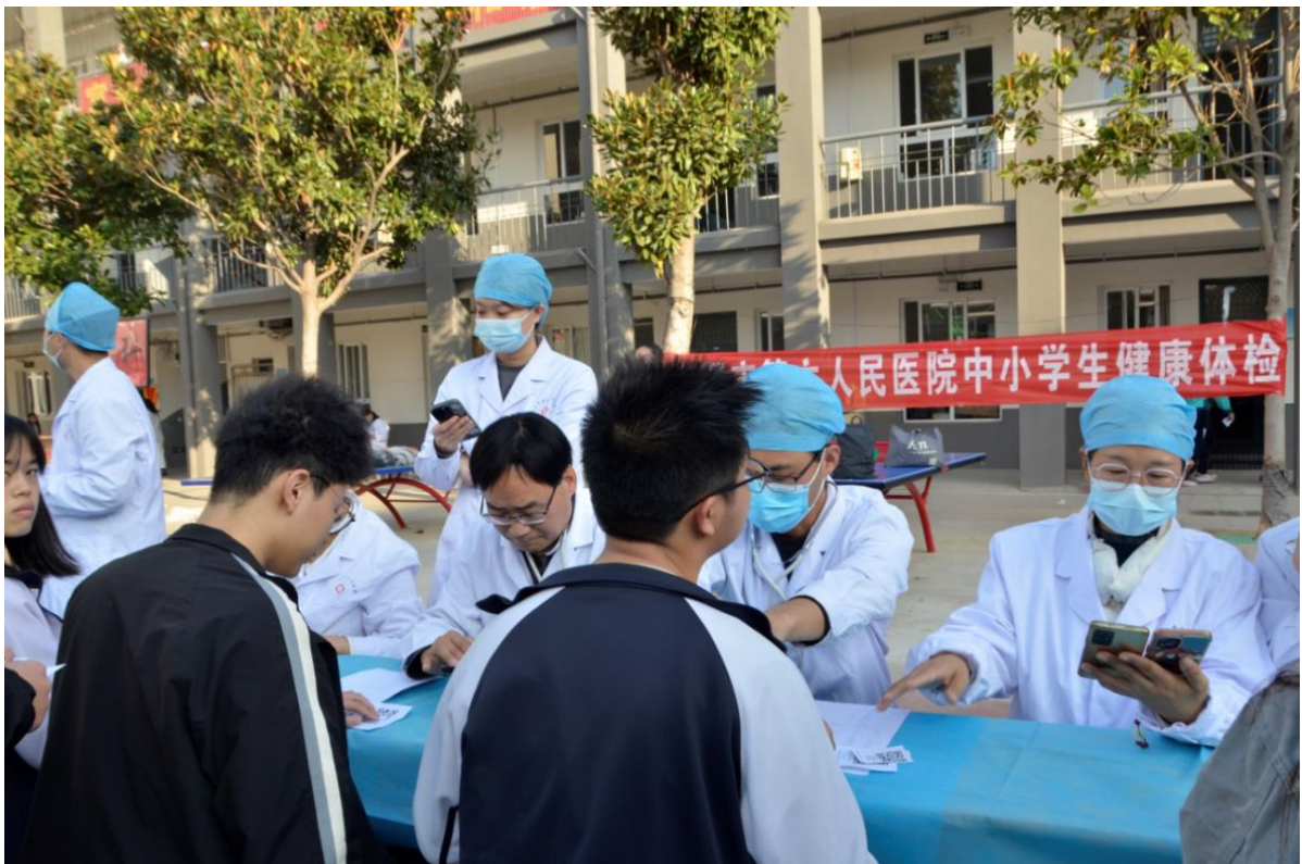
图 33：开展学生健康检查