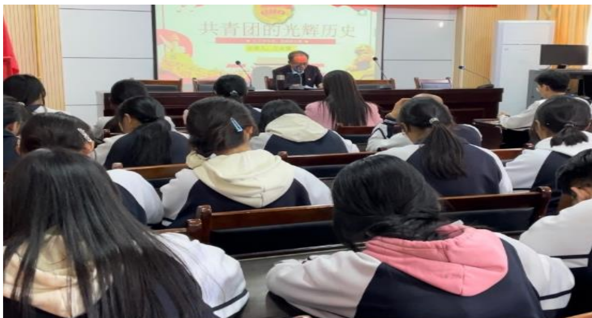
图 14：“回望光辉历程 传承红色基因”主题团课

办团课 4 期，邀请了校党总支书记、校团委书记和青年教师团员为广大团员、青年讲团课，内容涵盖“党的百年征程”、“共青团的光辉历史”“团歌学唱”、“纪念‘一二·九’抗日救亡运动”等。