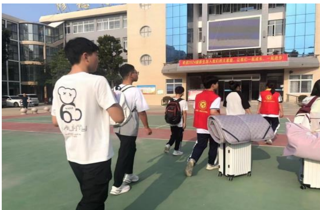
图 27: 迎新志愿服务活动