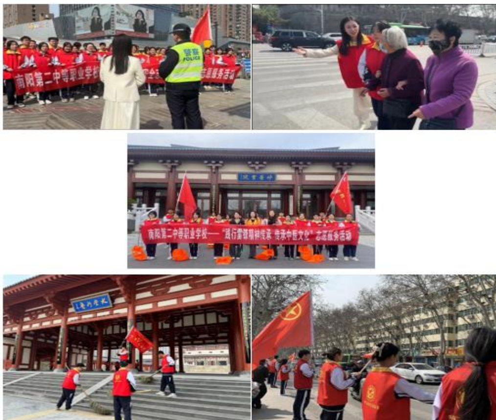
图 26: “学雷锋精神展志愿风采”三月学雷锋月系列志愿服务活动