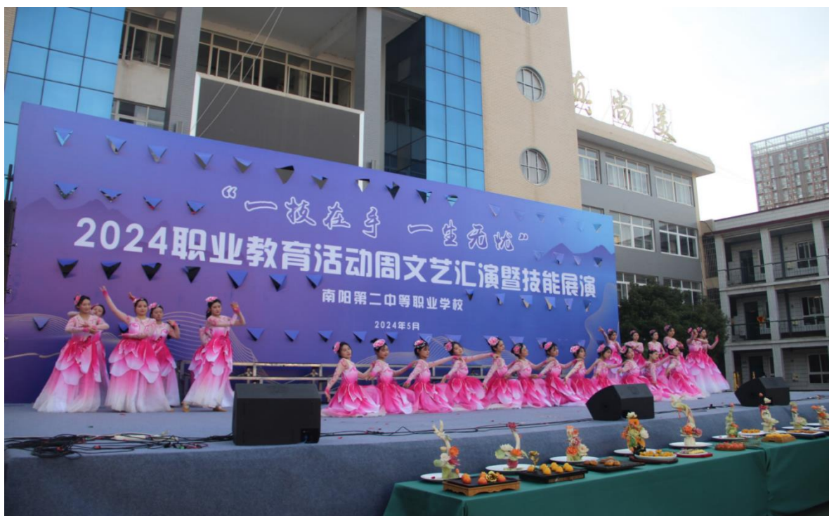
图 35：2024 年职业教育活动周文艺汇演