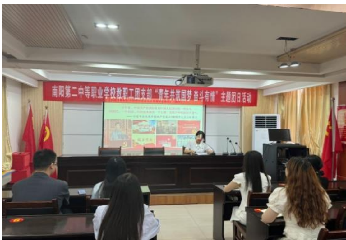
图 15：“青年共筑中国梦奋斗有情”主题团课