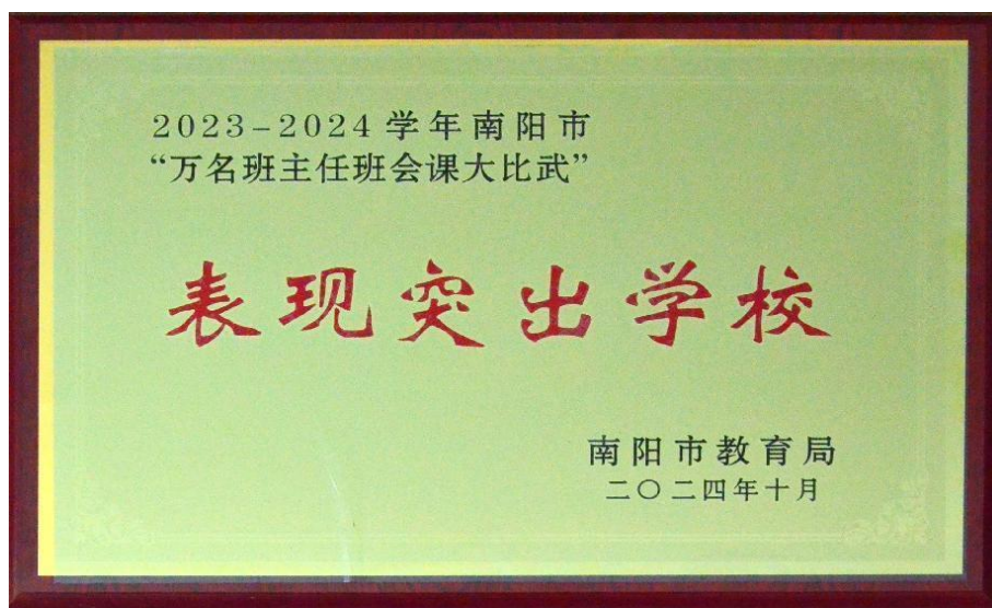
图 6：2023-2024 学年南阳市万名班主任班会课大比武表现突出学校