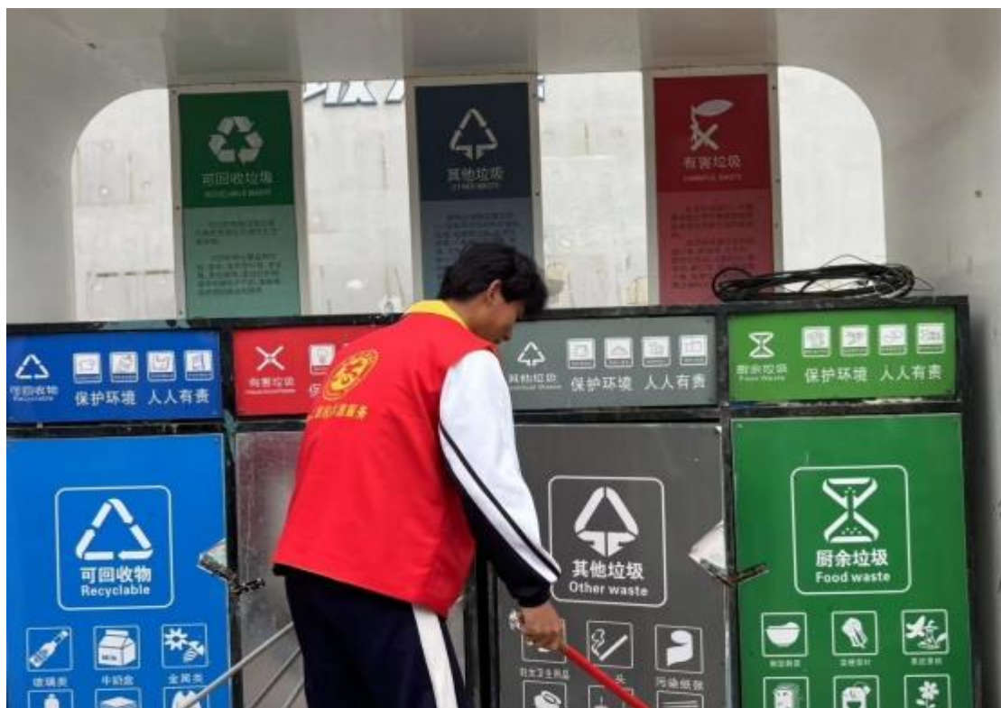
图 28: 打扫卫生