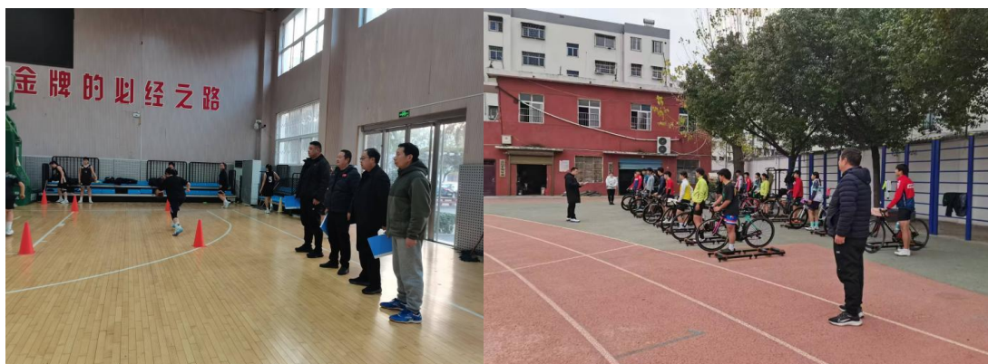
图 11. 教练员在进行训练听评课

师中提倡使用文明用语，提倡养成文明习惯，提倡课余时间多与学生交流，提倡因材施教。