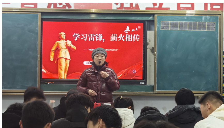
图 9：团委开展学习雷锋精神活动

学校始终坚持“德、智、体、美、劳”全面发展的育人理念，以“学生满意、家长满意、社会满意”为目标，秉承“崇德博学，尚勇竞技”的校训，以立德树人为根本，狠抓学生素质教育，学生思想政治素质总体上是健康的、积极向上的。利用重大节日组织各班开展健康、有益，寓教于乐的各种文体活动和趣味活动等；组织开展各类演讲比赛、“书法大赛”、各种主题的黑板报等系列活动。结合我校学生的实际情况，开展“弘扬宪法精神 争做守法公民”宣传宪法周活动，增强了同学们法治意识；开展一二九运动主题班会活动，增强他们的责任感和使命感；铸就信仰之基、传承红色精神主题班会活动培养在校学生群体的爱国主义和思政意识。通过一系列主题活动，从思想上引领学生树立正确的的世界观、人生观和价值观，筑牢信仰之基。