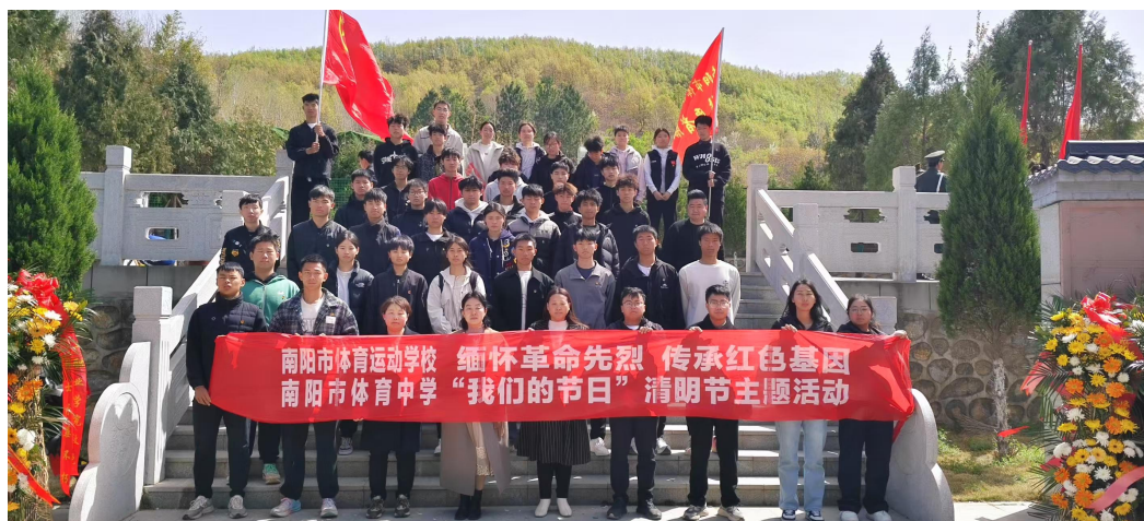
图 10：市体校开展清明节主题团日活动

自从红色文化进校园活动开展以来，我校加强革命传统教育，增强少年学生的爱国情感，弘扬和培育民族精神，组织开展了一系列红色文化教育活动，围绕“红歌嘹亮颂党恩，青春飞扬展风采”主题，校团委精心组织红色歌曲传唱活动。活动中，学生们传唱《没有共产党就没有新中国》《歌唱祖国》等经典红歌，将红色旋律与青春活力相结合，在激昂的歌声中重温党的光辉历程，感悟革命先辈的爱国情怀，有效推进了学校德育工作的提高。