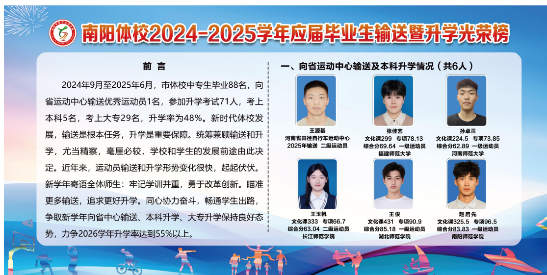
图 3. 南阳体校 2024-2025 年输送、升学光荣榜

校内测试，学生文化课合格率 100%，专业技能抽测合格率达 98% 以上，因我们是体育专业学校，学生体质测试合格率 100%，学生毕业率 98.5%。