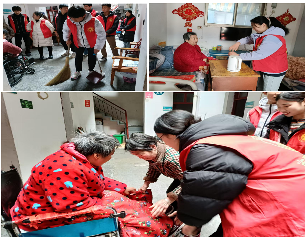
图 8：学生前往华山社区敬老院开展志愿服务活动

征求结对社区的建设性意见建议，并列入德育计划付诸实施；学校经常利用双休日、节假日、寒暑假等，带领学生走进社区，与社区居民一道开展多种活动，如：小手拉大手，公民道德共遵守；社区绿色行动；走进敬老院。这些活动的开展，开阔了学生的视野，启迪了学生的心灵，使我校学生在实战中进一步增强“在校做个好学生，在社区做个好居民”的文明意识，懂得了一个城市居民应尽的义务和责任。广大学生的“共爱社区，争做文明居民”实践行动，也带动了社区内广大家长、居民，不少居民主动和学生一起参加文明创建活动，积极为学生活动提供方便，共同解决活动中遇到的难题，共同为社区文明进步作出努力。