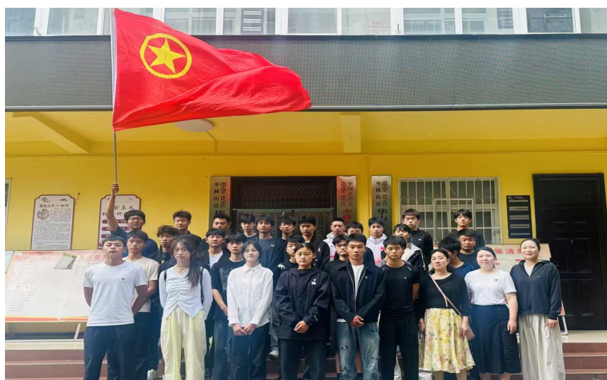
图 7：学生到华山社区进行志愿服务

我校立足学校工作实际和教育工作的特点，积极发挥自身文明示范作用，主动与社区居委会共同开展文明创建工作。为此，学校特成立了以党委书记、校长为组长，纪委书记、副校长为副组长、科室负责人等为相关人员为组员的共建活动领导小组，定期召开联席会，与所结对共建居委会分管领导共商结对共建活动，不定期座谈、互访，为双方文明创建工作提供积极有效的帮助。每周五，教职工去华山社区进行志愿服务。目前，结对共建活动已成为学校的常规工作，我校与华山社区居委会建立了良好的共建合作关系。