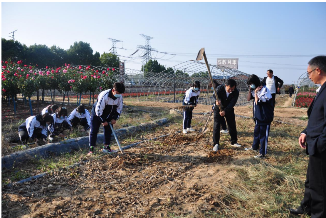
园艺专业实习实训