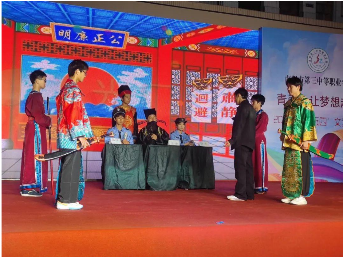
五四青年节文艺汇演