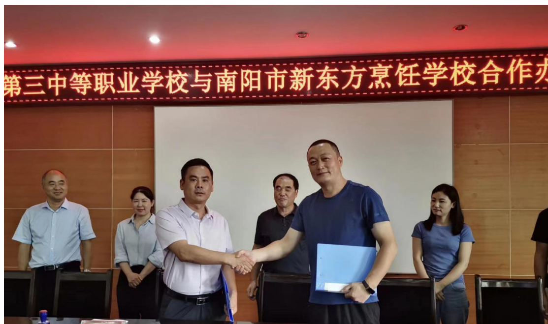
南阳市第三中等职业学校与新东方烹饪学校签订合作办学协议

落实习近平总书记关于发展南阳依托月季、艾草等资源 优势发展特色产业的重要精神，以卧龙区成教月季繁殖基地 作为园艺专业实习实训基地，助力区域特色经济发展。南阳 市第三中等职业学校有烹饪专业的优质师资，具备扎实的烹 饪基本功与娴熟地烹饪技能，并充分利用校内外教育资源， 与新东方烹饪学校强强联合，实施“产教结合，全真实训” 的人才培养模式。利用校外实践教学基地，培养教师和学生 的实践能力，实现优势互补，资源共享，互利共赢。