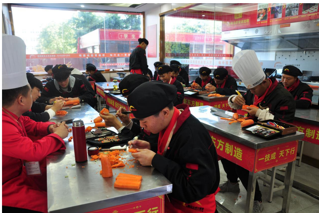
南阳市第三中等职业学校烹饪专业实习实训基地