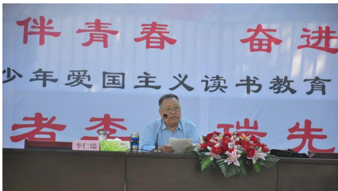
爱国主义读书教育活动