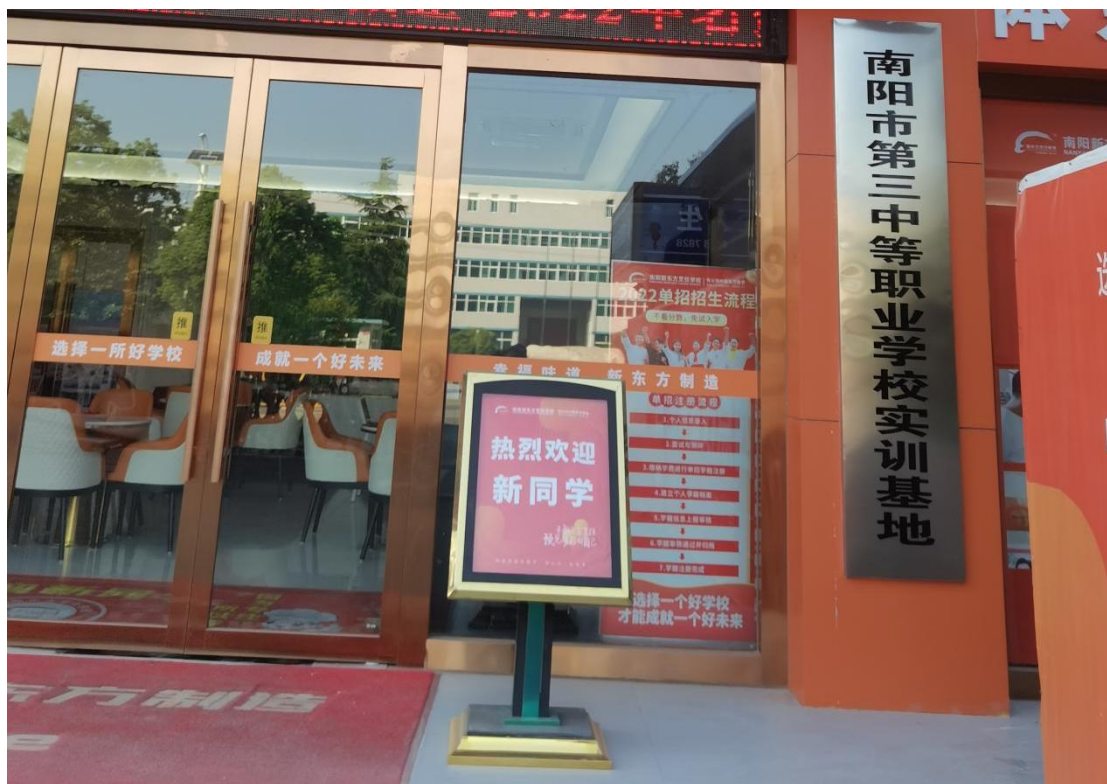
南阳市第三中等职业学校烹饪专业实习实训基地