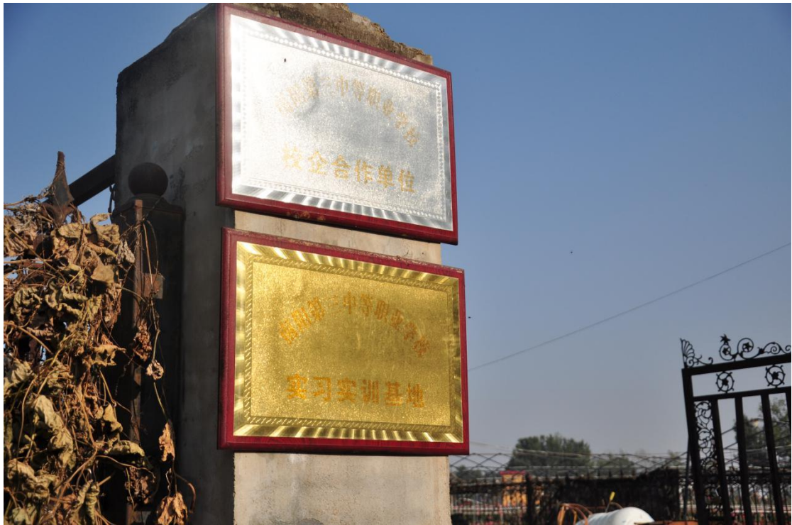
南阳市第三中等职业学校园艺专业实习实训基地