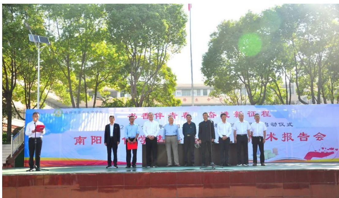
爱国主义读书教育活动

他们从中学会关爱，学会感恩，学会奉献。9月份，为增强学生爱国主义情怀，培育学生社会主义核心价值观，加强学生对南阳历史文化的了解，学校组织学生赴南阳市博物馆开展研学活动。开阔学生视野，全面提升学生的综合素质。10月份，开展了以“红心永向党，颂歌新时代”活动，使每一名学生深刻体会到新时代所肩负的历史使命，坚定了为实现国家富强、民族复兴、人民幸福而发奋学习、不懈奋斗的信念。