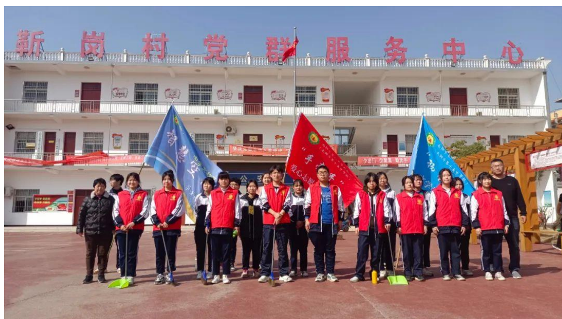
环境卫生清洁志愿活动