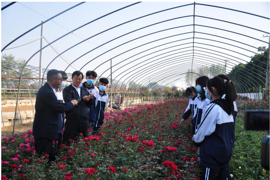
南阳市第三中等职业学校园艺专业实习实训基地