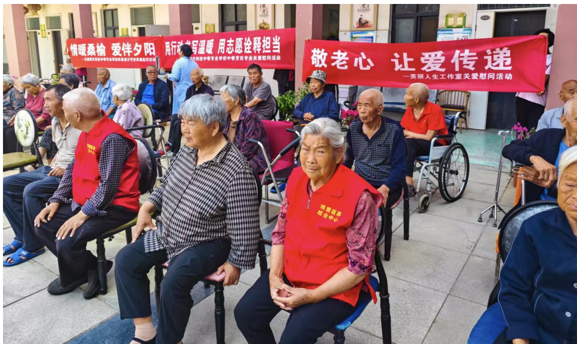
社旗县博爱养老中心开展爱心服务活动