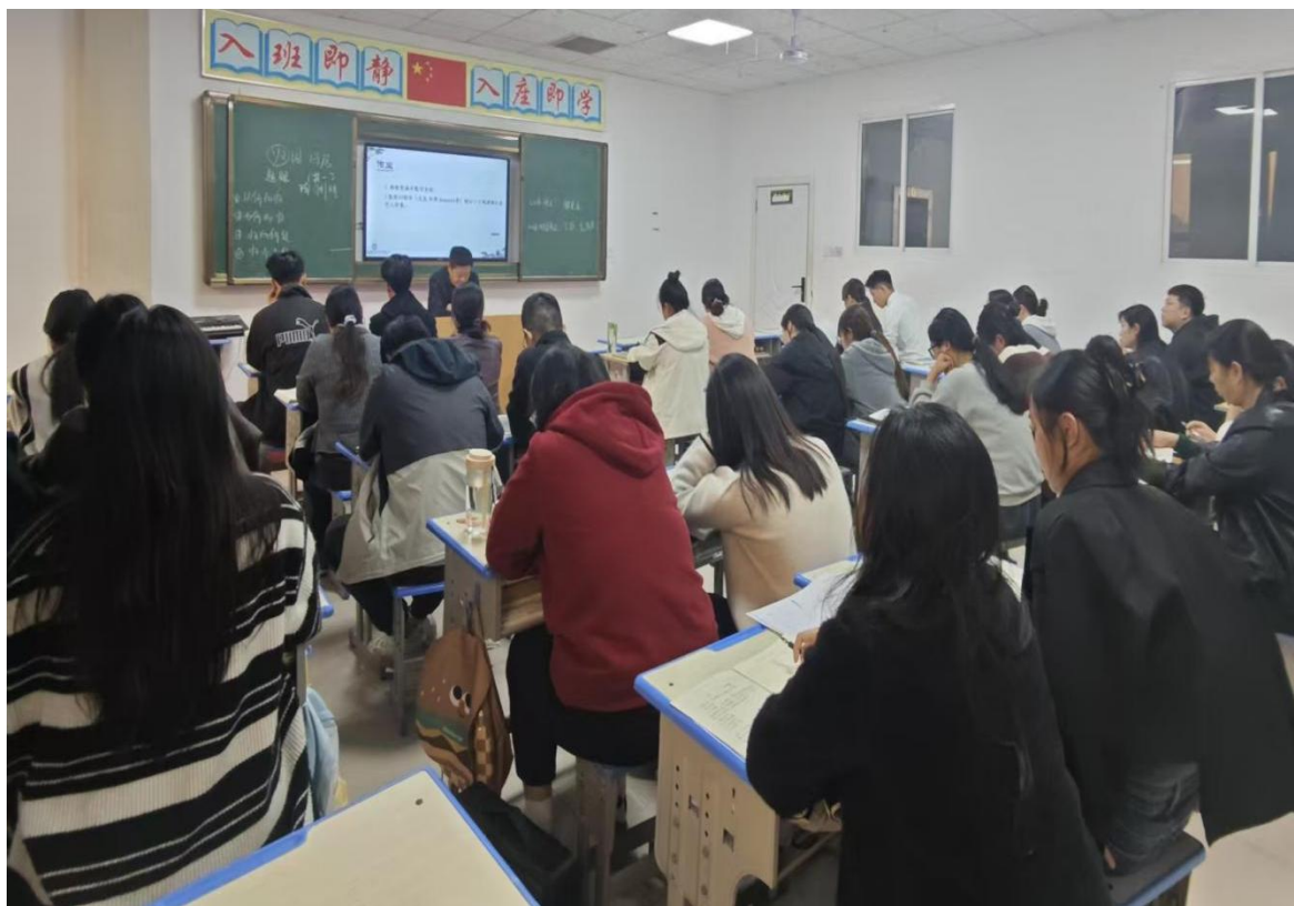
三结合四集中教研活动