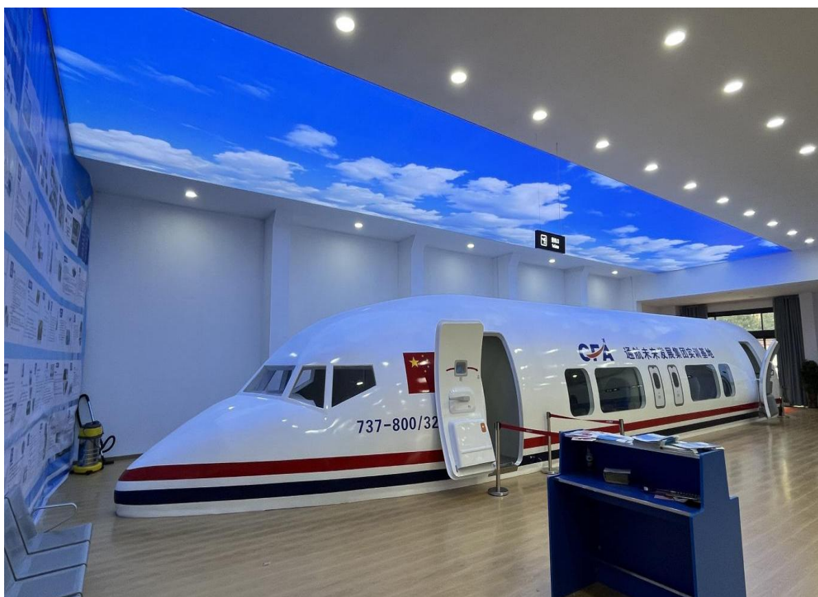
航空服务专业实训中心