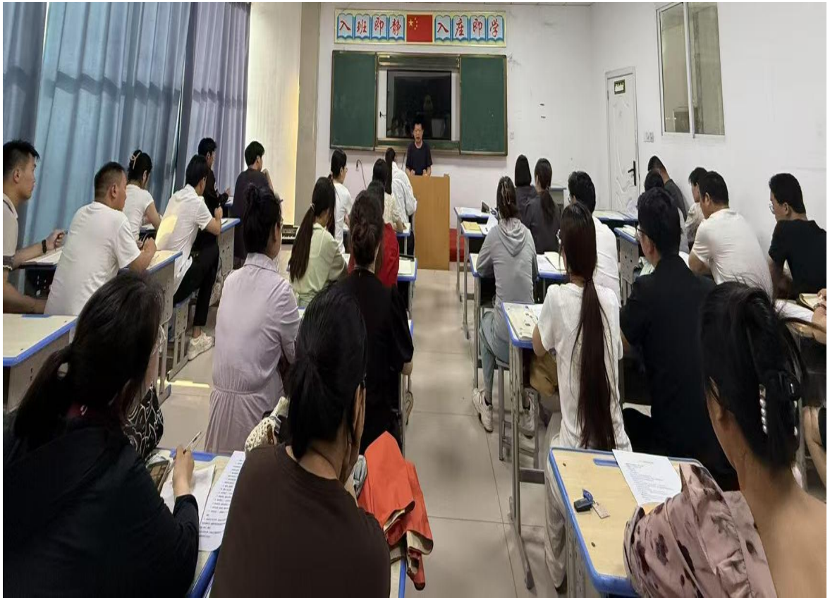
三结合四集中教研活动