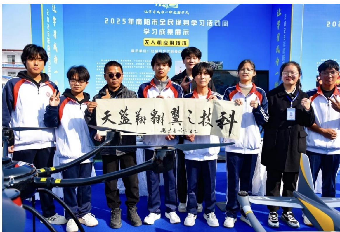
无人机专业亮相全民终身学习活动周