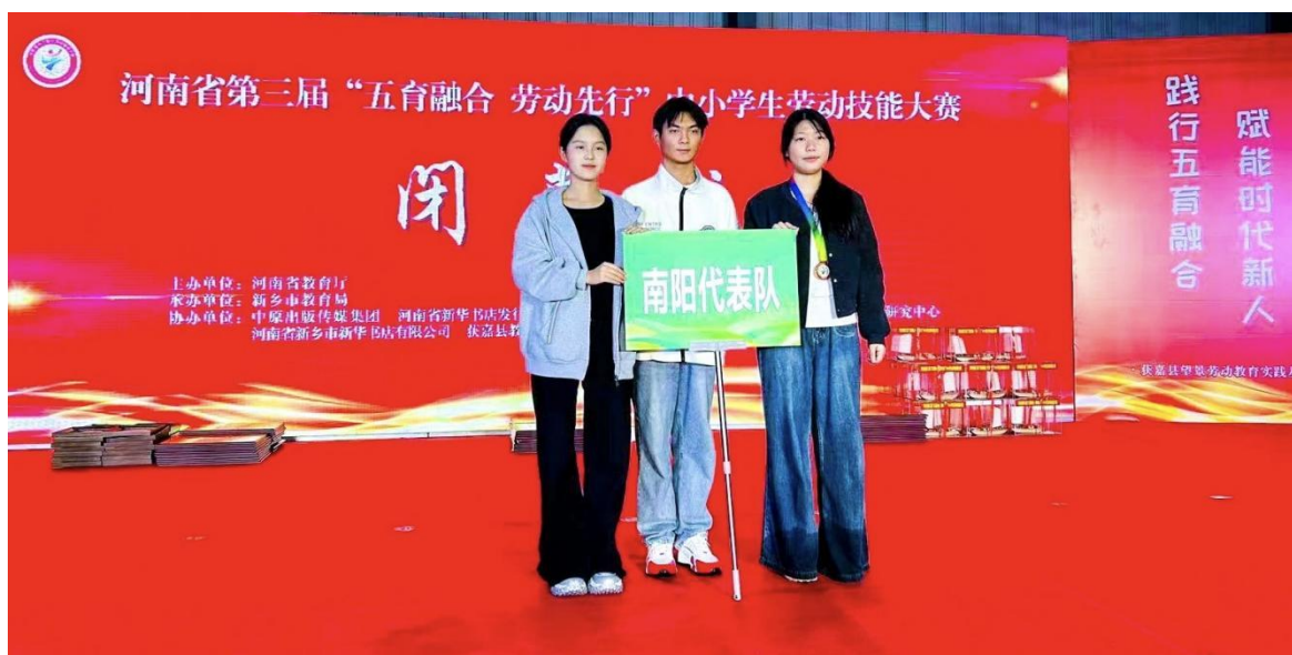
河南省第三届中小学劳动技能大赛