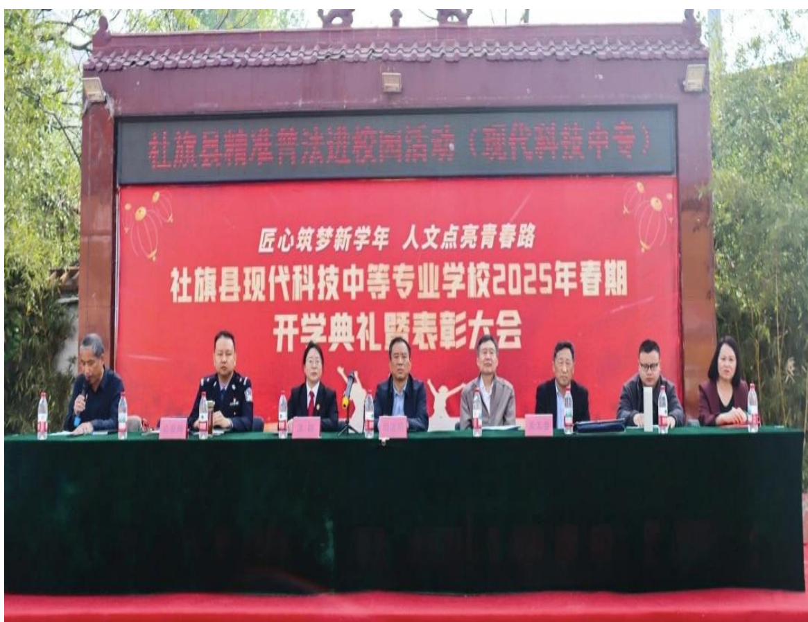
精准普法进校园活动