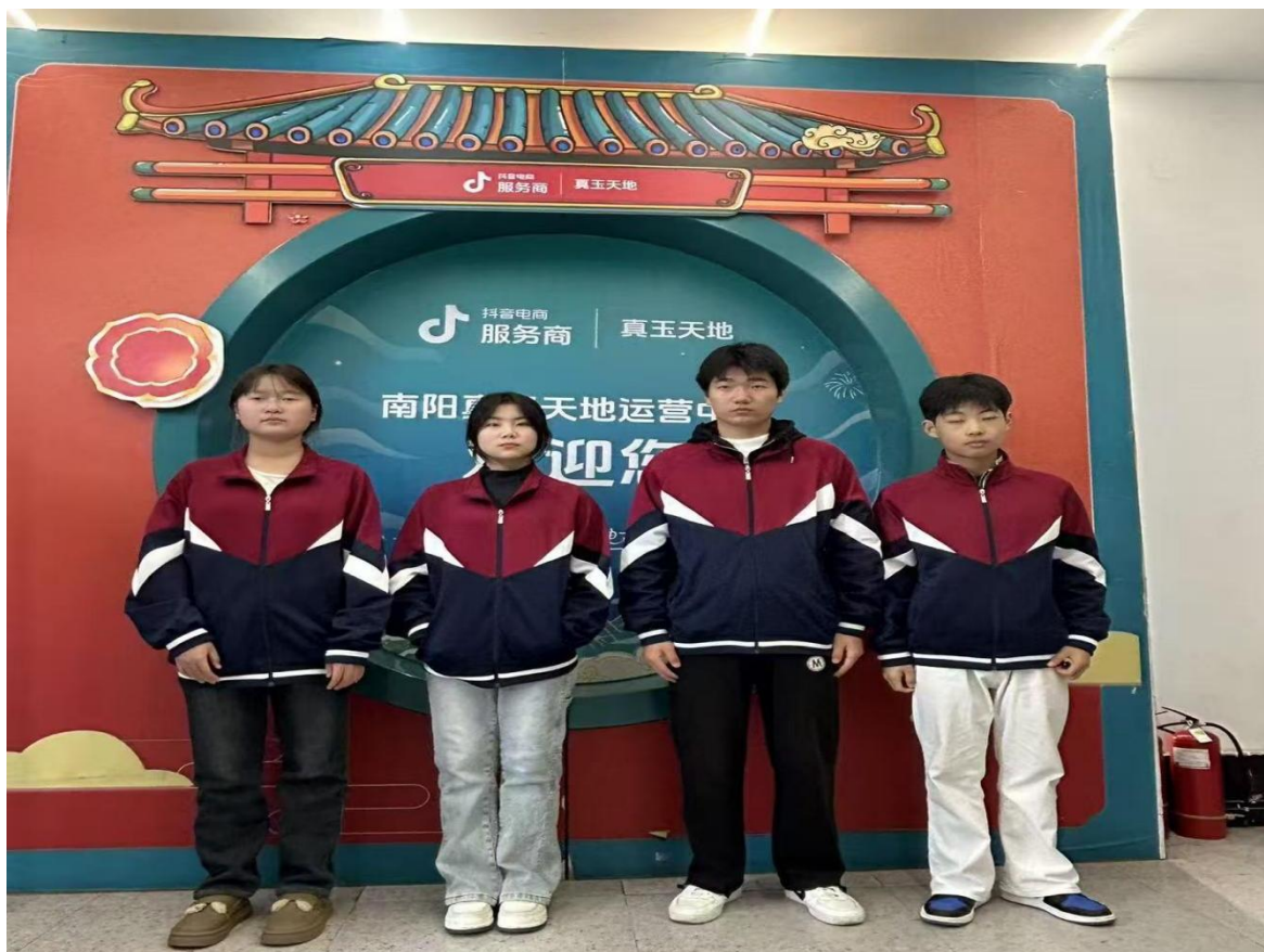
电商专业学生研学

2. 特色品牌打造：学校依托优质办学实力稳步发展，全力打造特色鲜明的职教强校，为学子成长保驾护航。持续做强“电商助农”特色品牌，组建“乡村振兴电商服务团队”，开展多场助农直播，为家乡特色农产品助力。航空服务实训中心通过南阳市职业教育示范性实训基地验收，全年向合作航空公司输送专业人才35人。无人机专业是面向智能制造与低空经济的综合性前沿学科，深度融合航空技术、人工智能与自动化控制，我校无人机专业的师生多次深入晋庄镇等乡镇的田间地头开展助农活动，影响力持续提升。