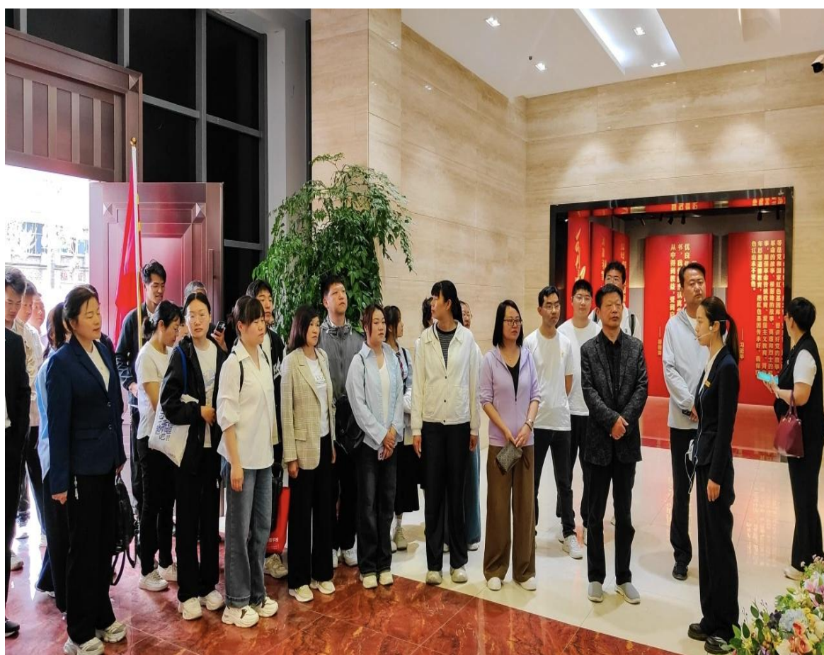
确山竹沟革命纪念馆红色研学活动