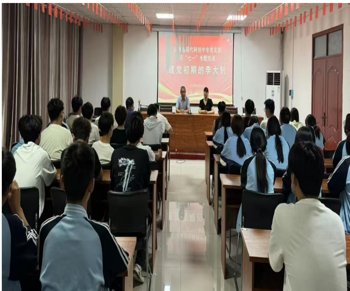
党员&团员专题党课

深化党建带团建工作，新增团员92名，组织团员开展“红色研学”“乡村振兴助农”等主题实践活动18场，将思政教育贯穿人才培养全过程，共青团组织在学生思想引领、实践育人中的作用进一步凸显。