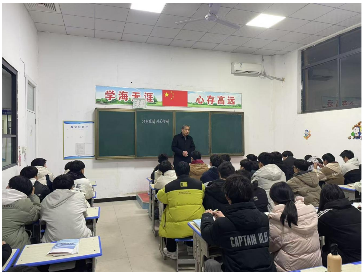
“为党报国 以技争光 ”主题党建思政课活动