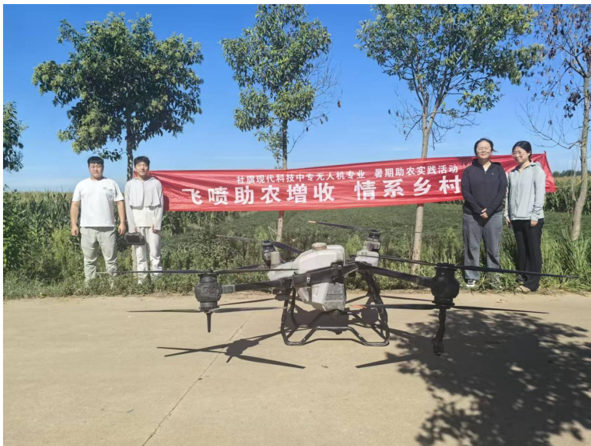
无人机专业助力后曹村经济合作社