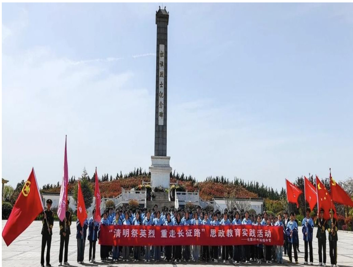
思政教育实践活动