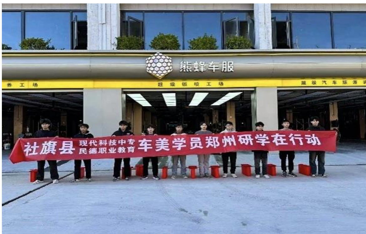
新能源汽车专业学生实践活动

2. 思政教育精准化实施：严格落实思政课程课时要求，开齐开足思政课程，推行“课程思政”教学设计改革，在工业机器人、中餐烹饪等专业课程中融入工匠精神、职业道德等内容；全年开展“大国工匠进校园”“职业规划大讲堂”等主题活动15场，覆盖学生850余人次。