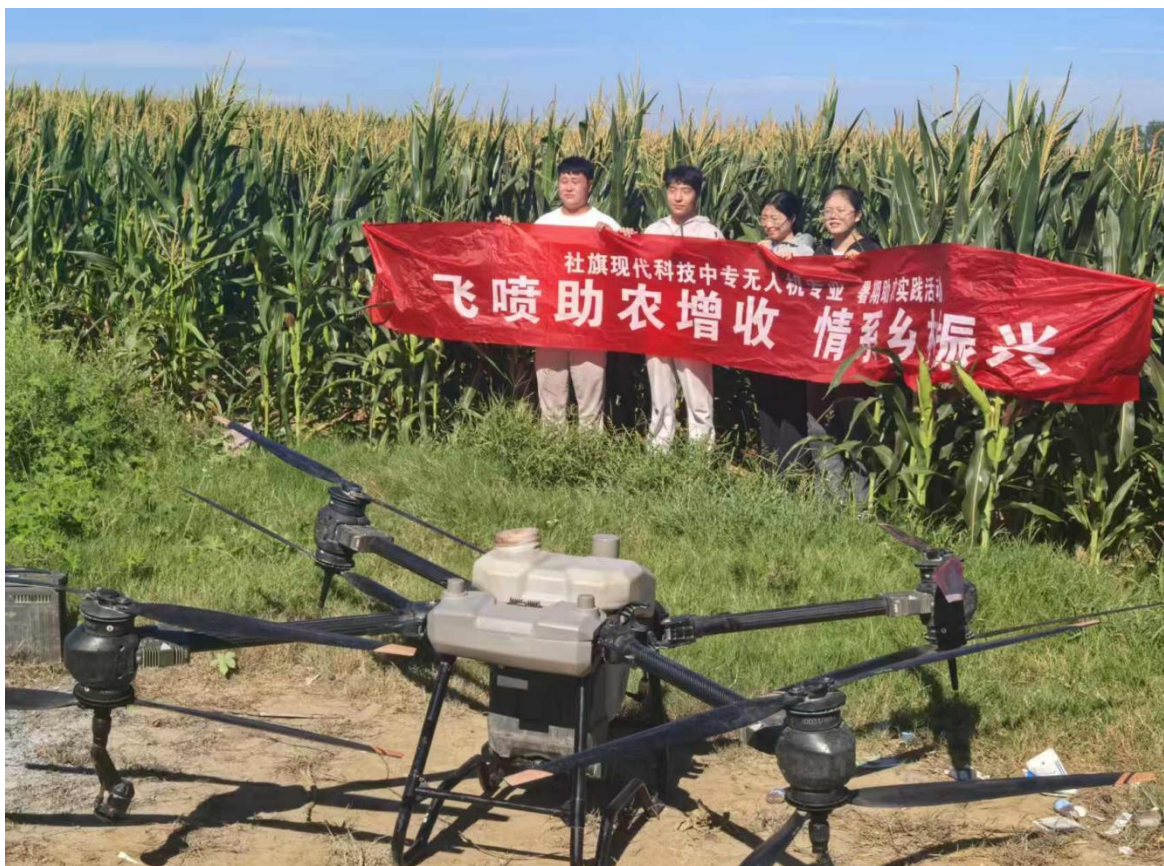
无人机专业助力后曹村经济合作社