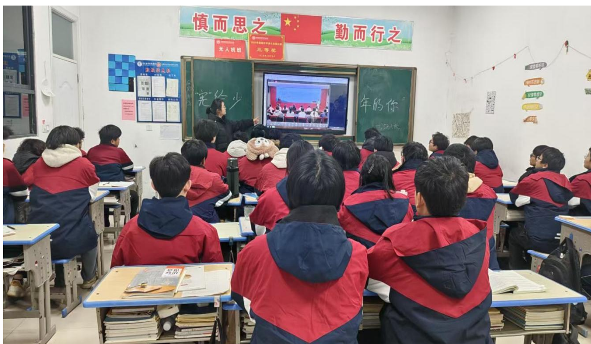
学习宪法主题教育班会