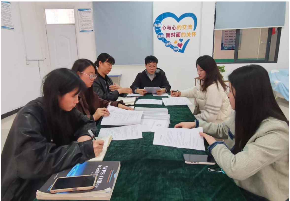
心理辅导中心工作会议

3. 心理健康教育专业化推进：完成全校在校生心理健康普查，建立个性化心理档案860份；开展“阳光心理”团体辅导15场、一对一心理疏导68人次，构建“班级-年级-学校”三级心理危机预警体系，全年未发生学生心理危机事件。