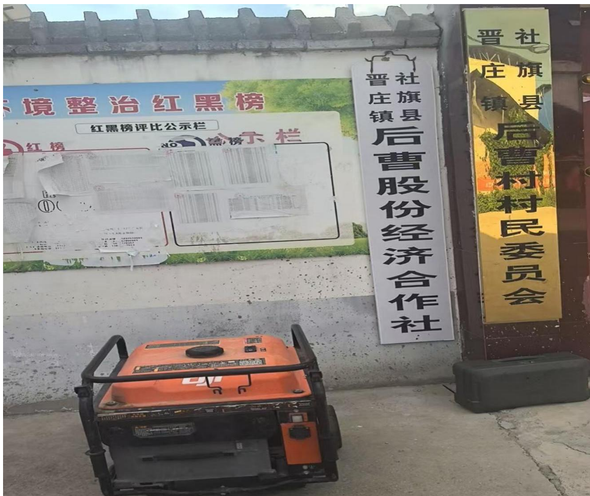
无人机专业对口帮扶晋庄镇后曹村