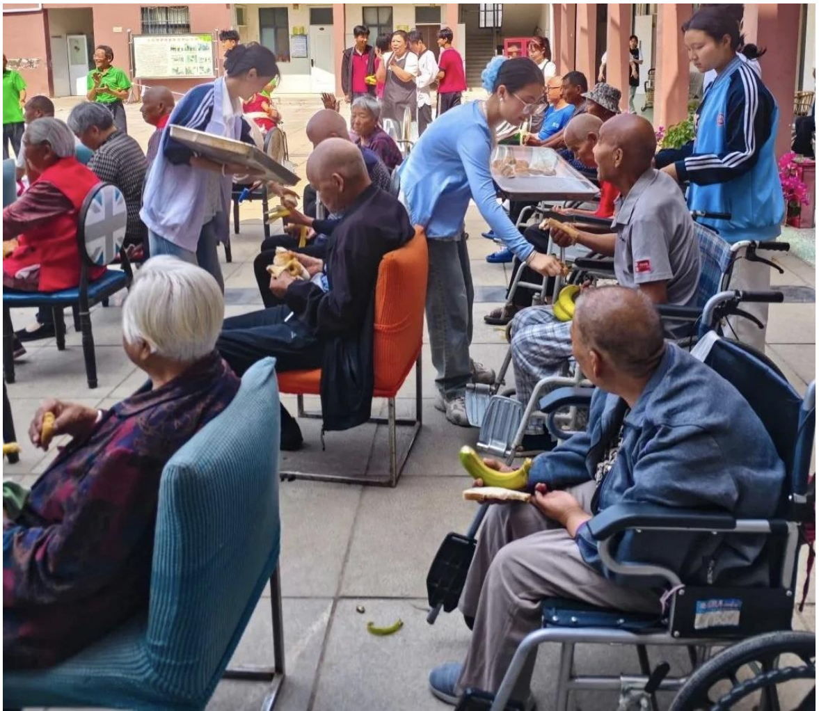
社旗县博爱养老中心开展爱心服务活动