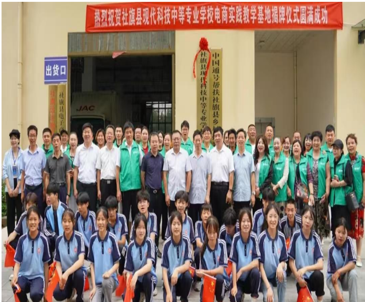
中国通号电商实践教学基地揭牌仪式

学校紧扣县域产业集聚区发展需求，调整优化专业布局，发挥专业优势为县域企业提供技术支持，组织师生多次参与乡村振兴帮扶行动，实现校企互利共赢，彰显职业教育服务地方经济发展的功能。