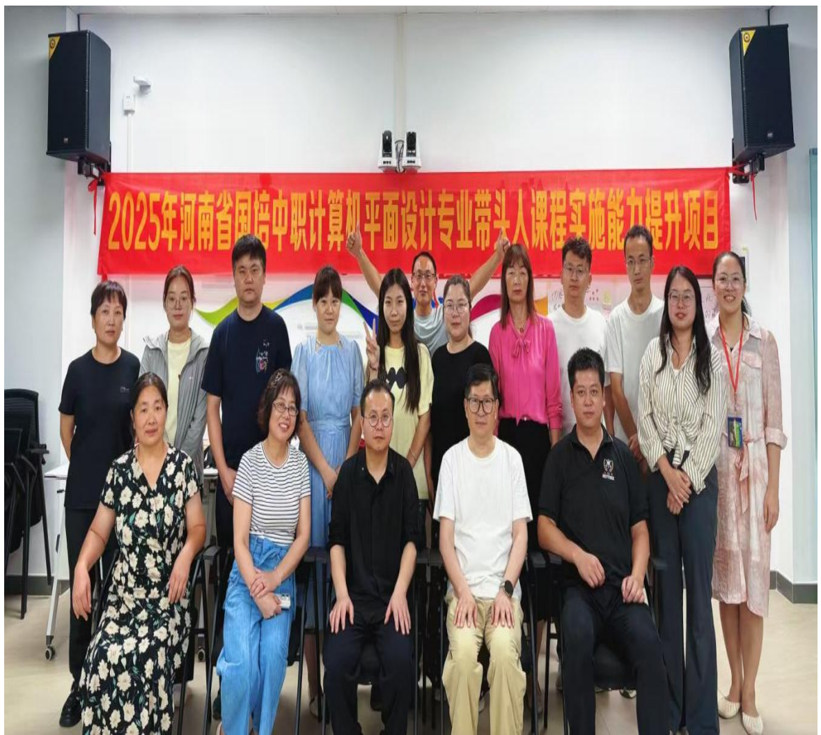
教师外出学习培训