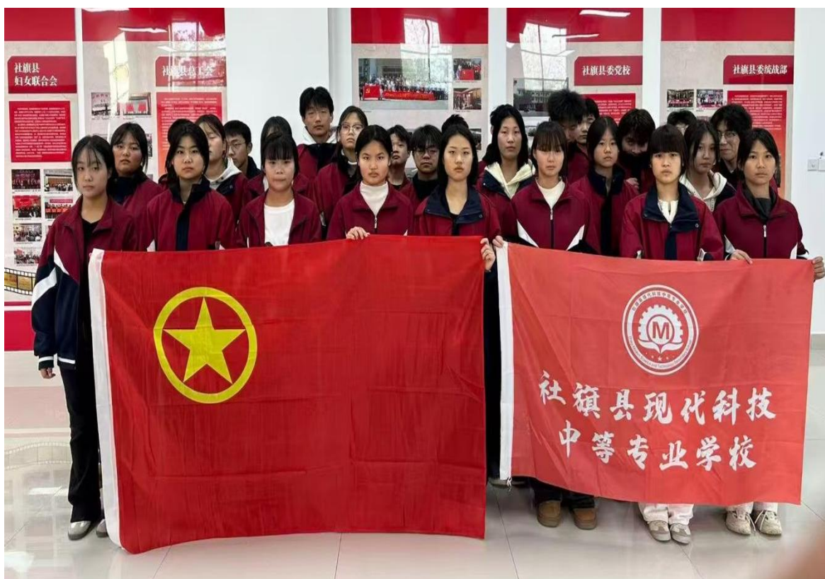
团员参观建县60周年图画展