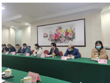
职业等级专家评审