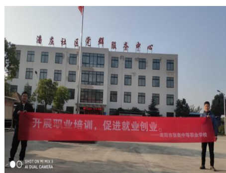
职业培训走进潘庄社区