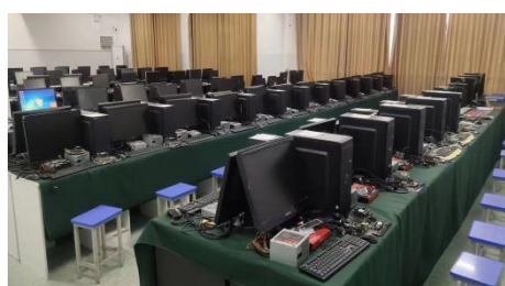
职业等级计算机维修工实训室