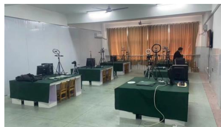
职业等级电子商务实训室