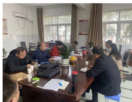
职业等级专家评审